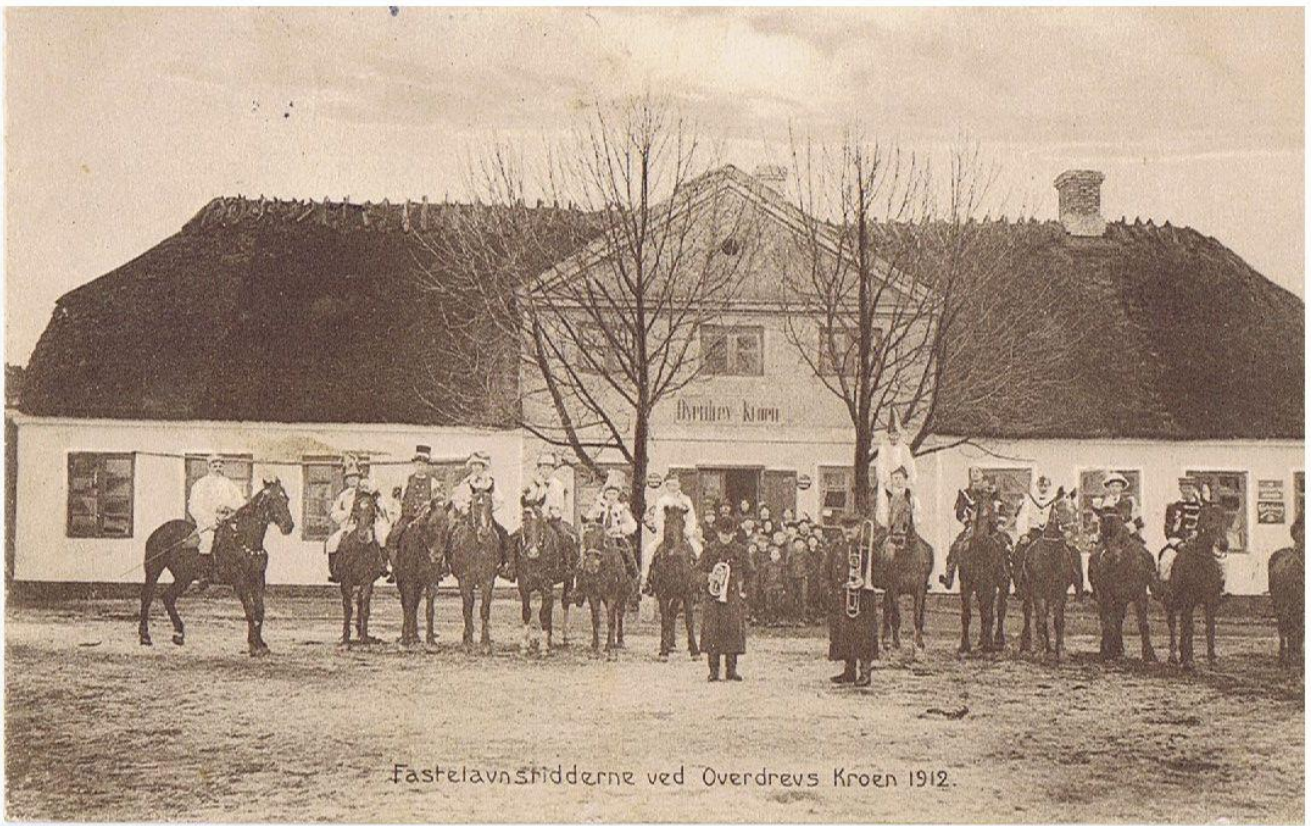
Fastelavnshjyderne ved Overdrevs Kroen 1912.